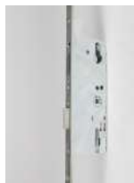
SERRURE 3 POINTS