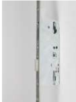
SERRURE 3 POINTS